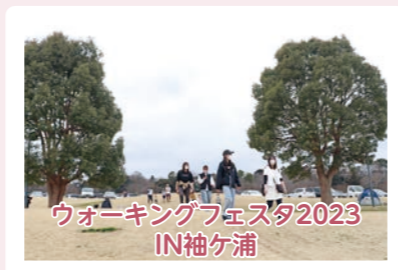
ウォーキングフェスタ2023 IN袖ケ浦