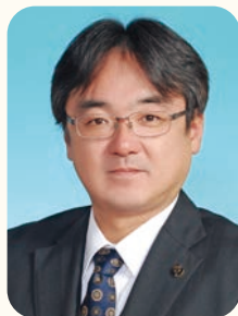
袖ヶ浦市長 粕谷 智浩

人口……66,029 (+104) 男……33,502 (+64) 女……32,527 (+40) ・転入…257 ・転出…143 ・出生…50 ・死亡…60 世帯……29,564 (+76)