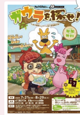
初の謎解き イベントを 開催!