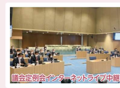
議会定例会インターネットライブ中継