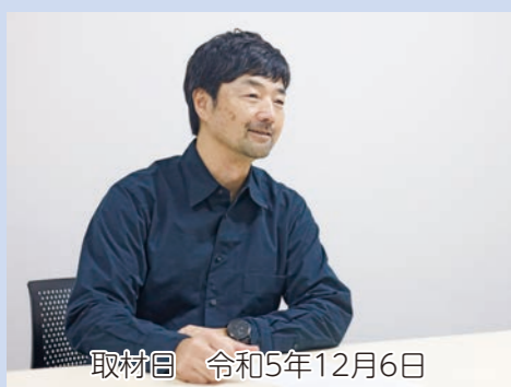
取材日 令和5年12月6日

高校を卒業してプロになった僕にとっては、世界で活躍していた選手とロッカーチームを共にしたことが、とてもショッキングなできごとでしたね。彼らは僕の想像を超えるメンタリティや考え方を持っていて、平和な日本を生きてき