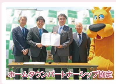
ホームタウンパートナーシップ協定