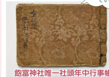
飽富神社唯一社頭年中行事帳