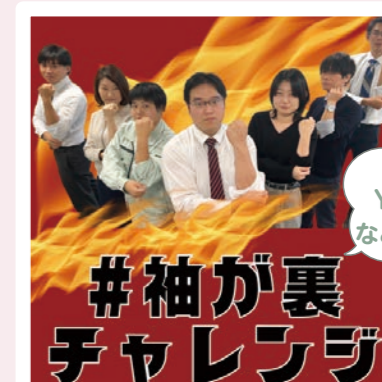
市公式 YouTube などに投稿中!